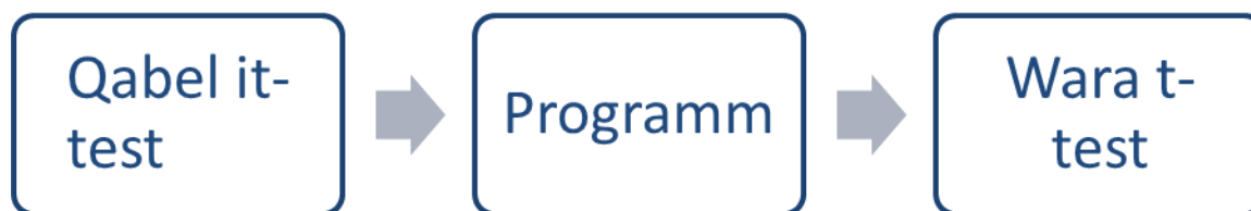
Figura 2: Eżempju ta' tfassil bażiku mhux sperimentali ta' qabel u wara l-programm

Tfassil bażiku tal-evalwazzjoni jista' jidher hekk: