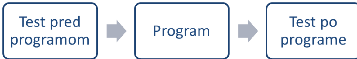
Obrázok č. 2: príklad základnej neexperimentálnej koncepcie pred a po

Základná koncepcia hodnotenia by mohla vyzerať takto: