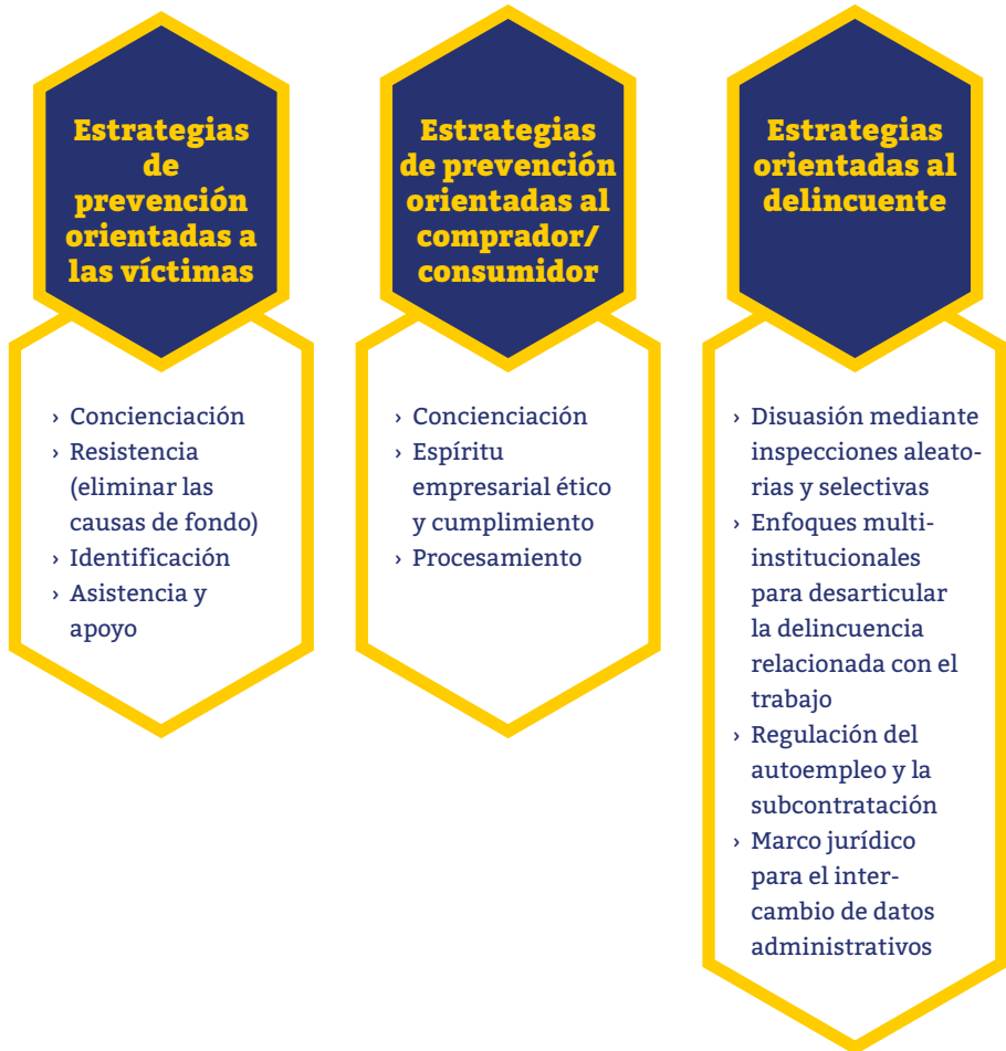
Figura 2. Resumen esquemático de las estrategias de prevención de la explotación laboral y los delitos relacionados con el trabajo.

y los permisos de trabajo (temporales) pueden obtenerse a veces a través de aplicaciones web, hace que la UE tenga muchas menos posibilidades de identificación que muchas otras regiones del mundo.