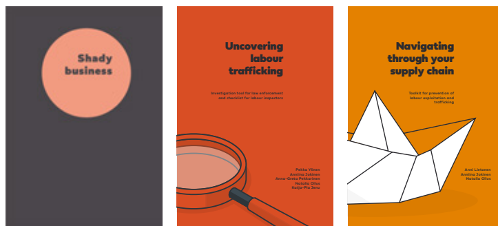
Figura 3. Portadas de algunas de las publicaciones elaboradas por el proyecto FLOW.

Todas las publicaciones están disponibles en inglés, finés, estonio, búlgaro y letón en https://heuni.fi/-/flow