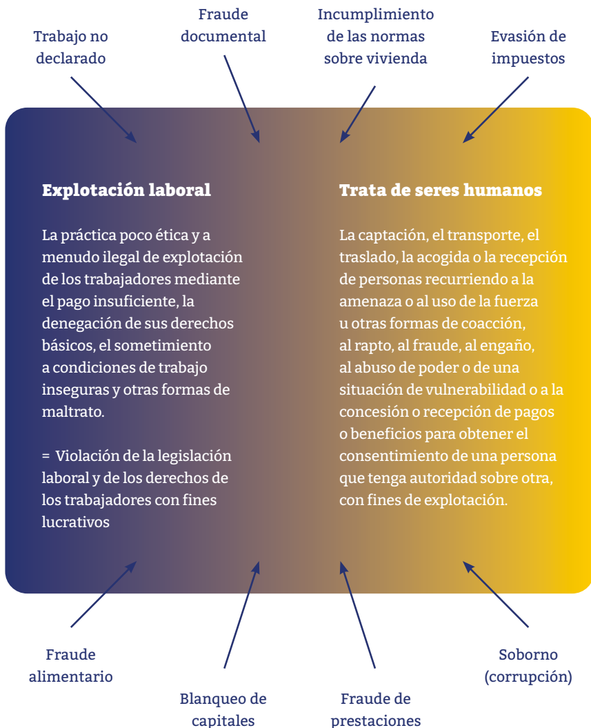
Figura 1. Los delitos relacionados con el trabajo engloban una serie de actividades delictivas que no se encuentran en el continuo explotación-trata, pero que a menudo forman parte de un esquema de explotación-trata, por lo que deben considerarse como posibles indicadores de explotación laboral y trata.