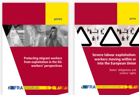
Figura 4. Dos de las publicaciones de la FRA sobre la explotación laboral grave en la UE.

Estos y otros recursos sobre la explotación laboral pueden encontrarse en la página web de la FRA: https://fra.europa.eu/en/themes/trafficking-and-labour-exploitation