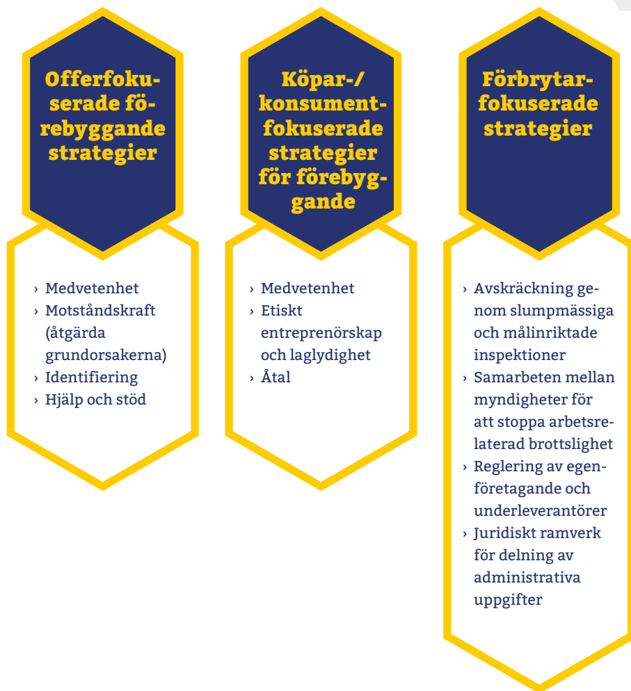
Figur 2. Schematisk översikt över strategier för att förebygga utnyttjande av arbetskraft och arbetsrelaterad brottslighet.