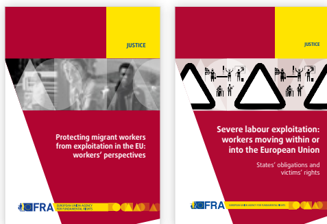
Figur 4. Två av FRA:s publikationer om allvarligt utnyttjande av arbetskraft i EU.

Dessa och andra resurser om exploatering av arbetskraft finns på FRA:s webbplats: https://fra.europa.eu/en/themes/trafficking-and-labour-exploitation