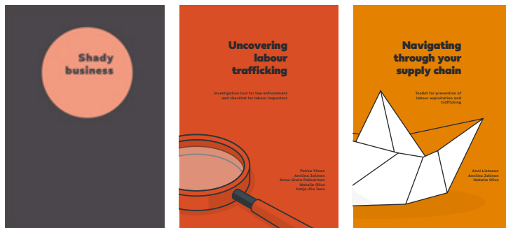
Figur 3. Omslag för några av publikationerna som FLOW-projektet tog fram.

Alla publikationer finns tillgängliga på engelska, finska, estniska, bulgariska och lettiska på https://heuni.fi/-/flow