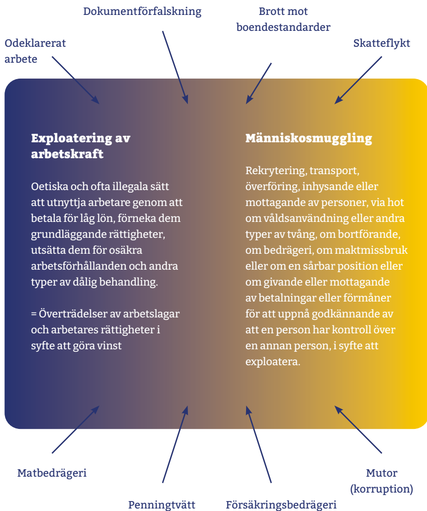
Figur 1. Arbetsrelaterad brottslighet täcker in ett antal kriminella aktiviteter som inte är exploatering eller smuggling, men som ofta är en del av en verksamhet som innefattar exploatering eller smuggling, och bör därför ses som potentiella indikatorer på utnyttjande av arbetskraft och människosmuggling.