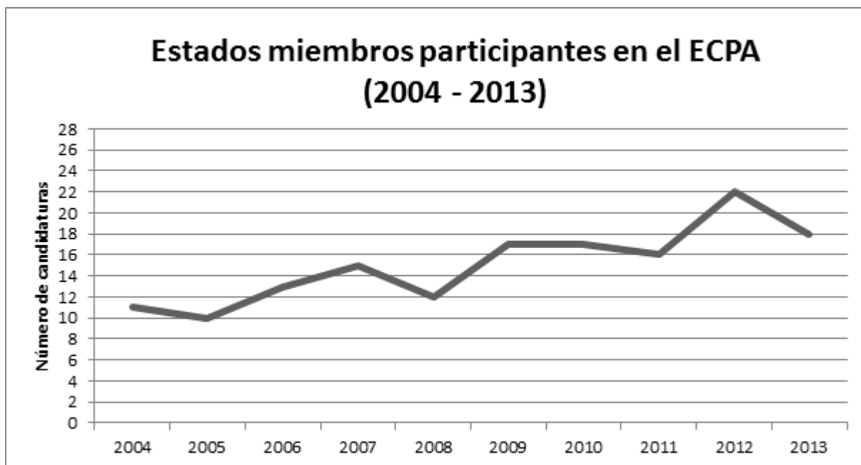
Gráfico 1: Número de participantes en el ECPA por año 2004-2013